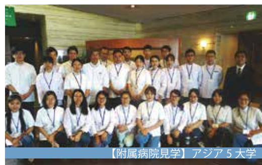
【附属病院見学】アジア5大学

ました。アジア5大学の学生たちは、余興を行うなどし、本学の学生とアジア5大学の学生のみならず、引率教員の先生方も本学教員との親睦を深めました。