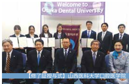
【修了証授与式】山西医科大学口腔医学院