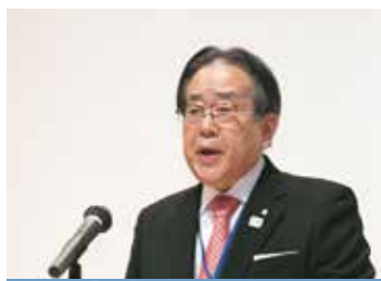
【FIS】理事長・学長 挨拶

また、FISが実現したのは、国際交流部だけではなく、大学院歯学研究科、歯学部教務部、歯学部学生部、医療保健学部並びに歯科衛生士専門学校のご協力があり、まさに全学一丸となった結果でありました。関係の皆様、ありがとうございました。