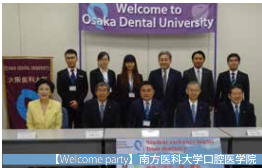
【Welcome party】南方医科大学口腔医学院