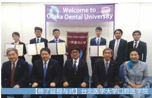
【修了証授与式】台北医学大学口腔医学院