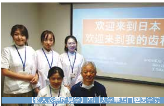
【個人診療所見学】四川大学華西口腔医学院