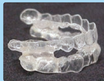
口腔内装置(マウスピース)