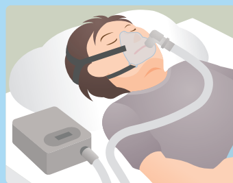
経鼻的持続陽圧呼吸療法(CPAP)