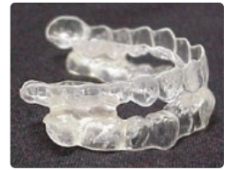
口腔内装置 (マウスピース)