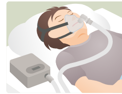
経鼻的持続陽圧呼吸療法 (CPAP)

全身に悪影響を及ぼす睡眠時無呼吸症。 当院では 医科 と 歯科 が連携して睡眠治療を行っています。