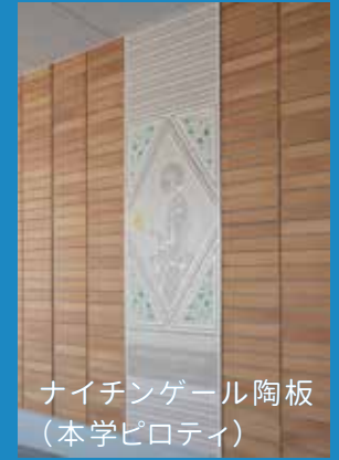
ナイチンゲール陶板 (本学ピロティ)